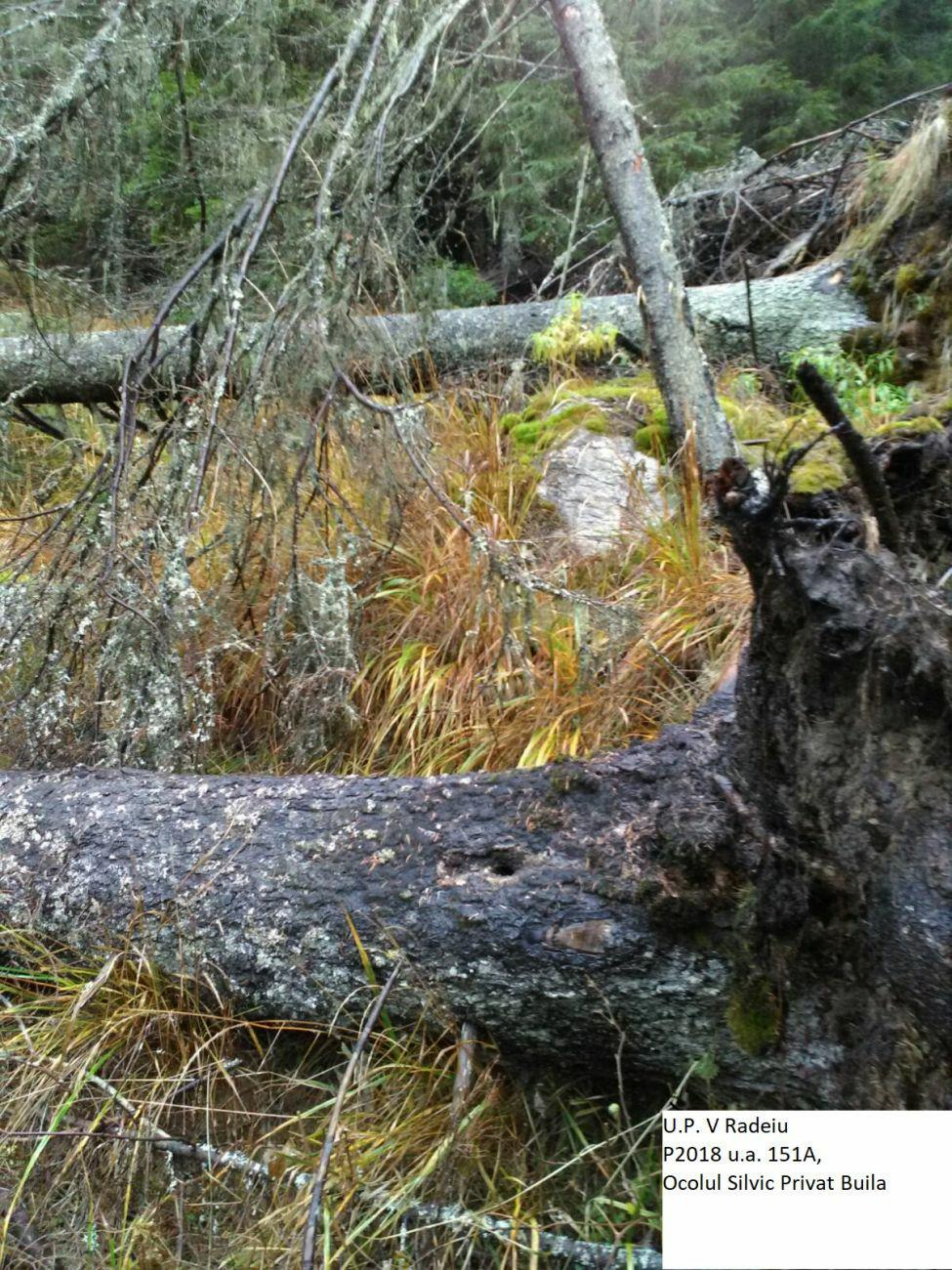
U.P. V Radeiu P2018 u.a. 151A, Ocolul Silvic Privat Buila